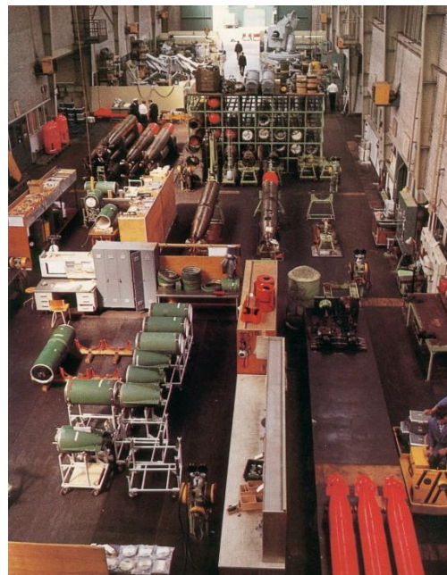
Torpedowerkplaats BW 1978