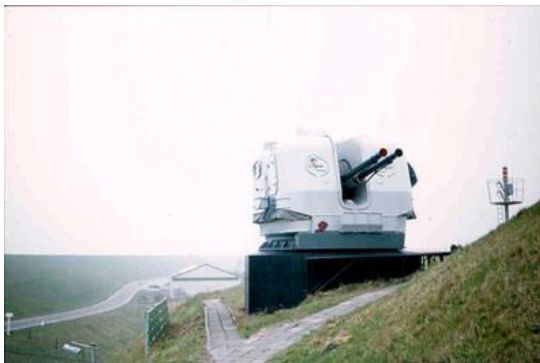
Mitrailleur 57mm op het zeefront van MK Erfprins

Deze foto's zijn overgenomen van de website www.onzevloot.weebly.com de tweede website www.debakstafel.nl bevat veel informatie en ook leuke wetenswaardigheden over de Marine van weleer. Leuk om eens een kijkje te nemen en misschien herkent u hier nog wel schepen of inrichtingen waar u in het verleden geplaatst was.